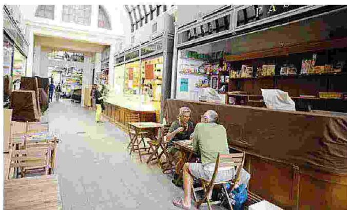
Poche persone all'interno del mercato Albinelli